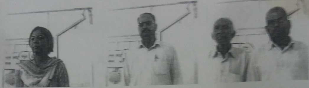
पट्टा देने वाला

Reg. No. 5100 Reg. Year 2007-2008 Book No. 1